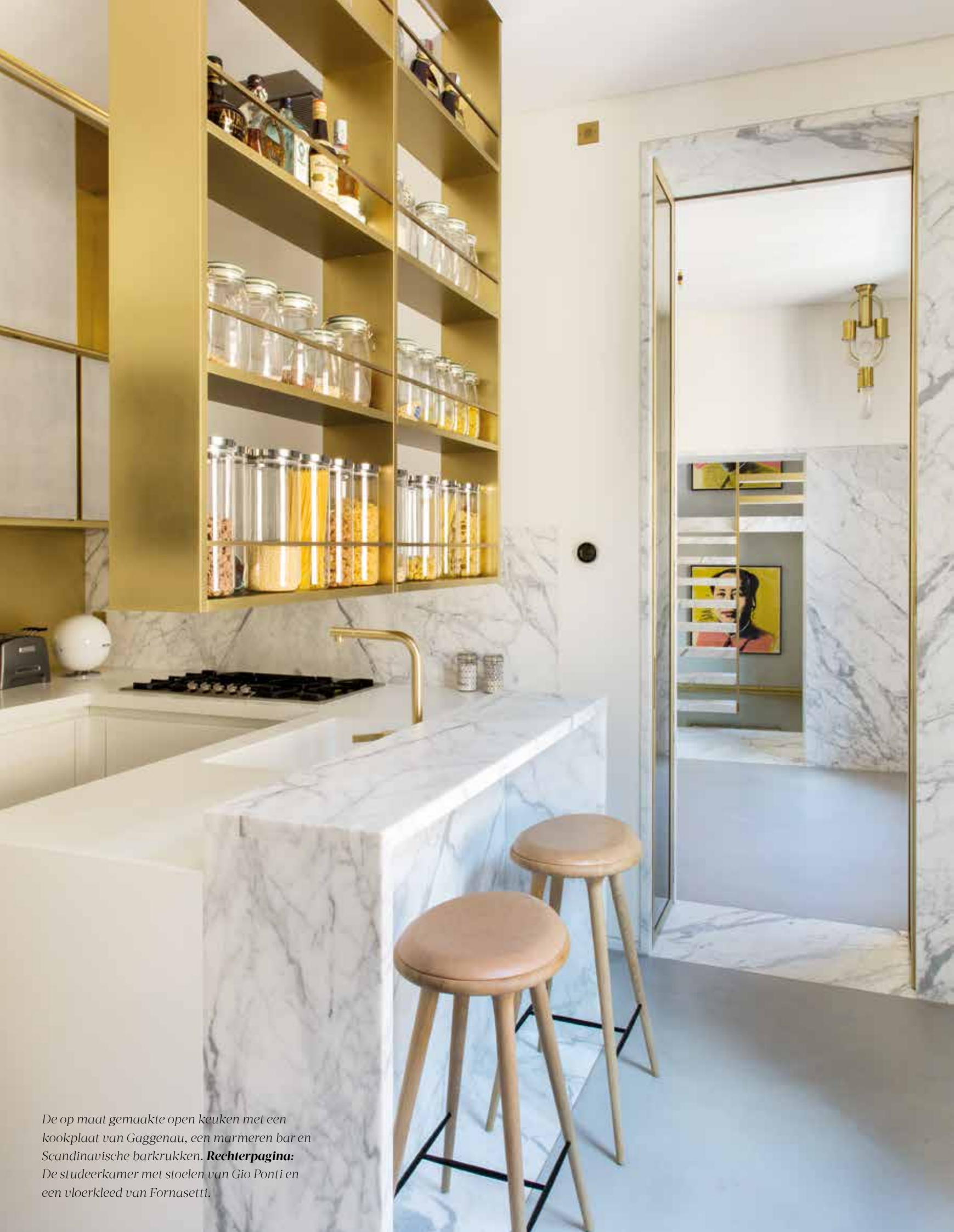
De op maat gemaakte open keuken met een kookplaat van Gaggenau, een marmeren bar en Scandinavische barkrukken. Rechterpagina: De studeerkamer met stoelen van Gio Ponti en een vloerkleed van Fornasetti.