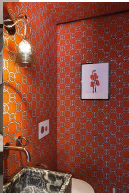
Badkamer met behang Fil d'Argent van Hermès. De kristallen wandlamp is van St. Louis. De kraan komt uit de collectie O van Studio André Putman en Christofle voor THG Paris. De marmeren wastafel is van Morsetto. Links: De kinderkamer met een eikenhouten vloer en gecapitonneerde achterwand. De ladder van het stapelbed is gemaakt van koolstofvezel. Rechterpagina: De lange marmeren gang en een portret van de Britse koningin door Hiroshi Sugimoto. Badkamer met strakke geometrische patronen, op de vloer, wand en in de gestreepte marmeren wastafels.